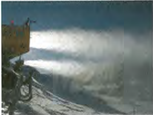
Schneekanone im Skigebiet Jakobshorn, Davos.

In höher gelegenen Regionen ist vor allem eine Abnahme der mittleren Schneehöhe in der für die Wintersportdestinationen wichtigen Frühwinterperiode (November, Dezember) zu beobachten.